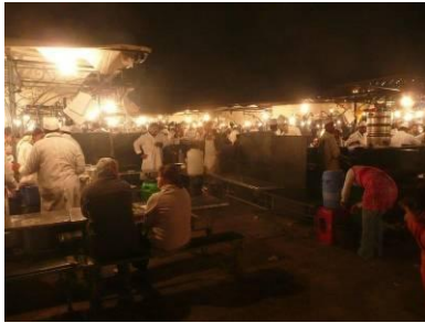
Djema El Fnaa