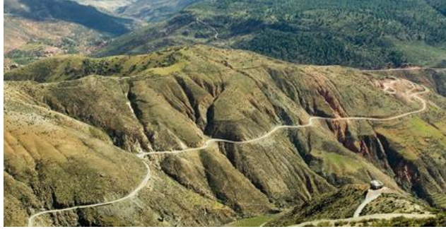
Tizi n Test Pas