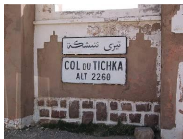
Col du Tichka